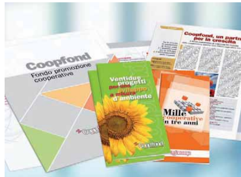
Gli ultimi prodotti di comunicazione realizzati da Coopfond

2008/2009 - Coopfidi Italia, il nuovo consorzio fidi nazionale in cui confluiranno buona parte dei confidi regionali oggi partecipati da Coopfond. Il fondo potrà partecipare rafforzando la sua presenza nel capitale, con ciò accrescendo la capacità di garanzia del consorzio nazionale stesso. Nella regione colpita dal terremoto è decollato intanto, con l'aiuto anche di Coopfond, Mutualcredito Abruzzo, mentre il Fondo partecipa al progetto nazionale di Legacoop "Mille cooperative in tre anni".